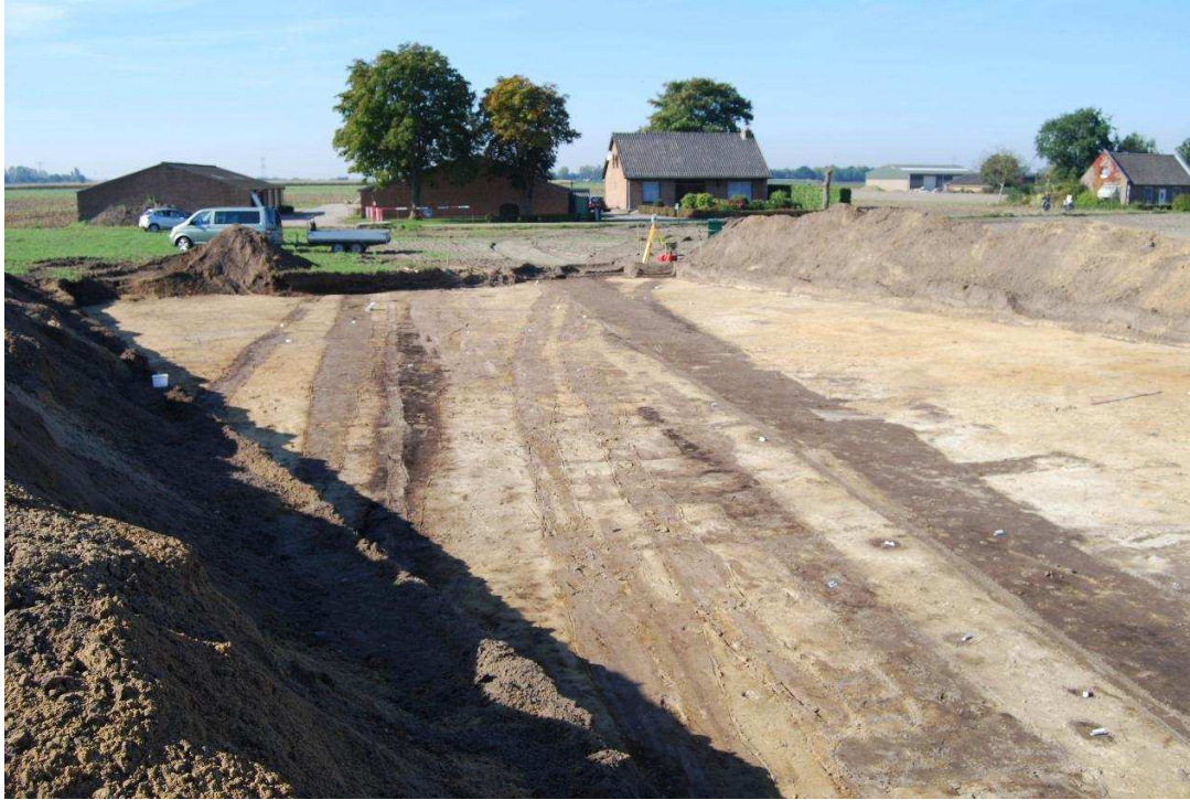
Karresporen in het zand geven aan hoe de Herweg als verlengde van het Terheijdens spoor oostwaarts liep