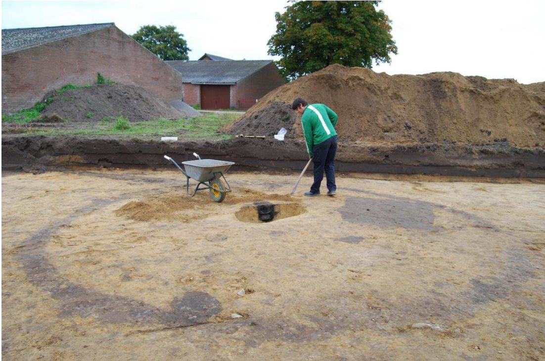
Een perfect urngraf, zoals het hoort: een kringgreppel om een grafkuil heen, met daarin een compleet bewaard gebleven urn